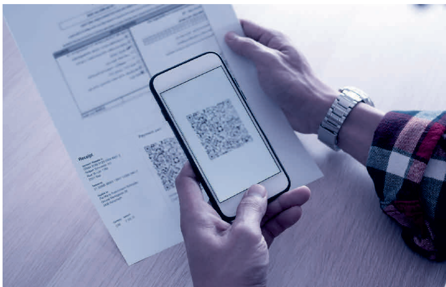
Scannen und fertig: Der QR-Code enthält alle relevanten Rechnungsdaten.

Lesen Sie mehr zum Thema im Blogbeitrag von TREUHAND|SUISSE unter www.treuhandswiss.ch/blog