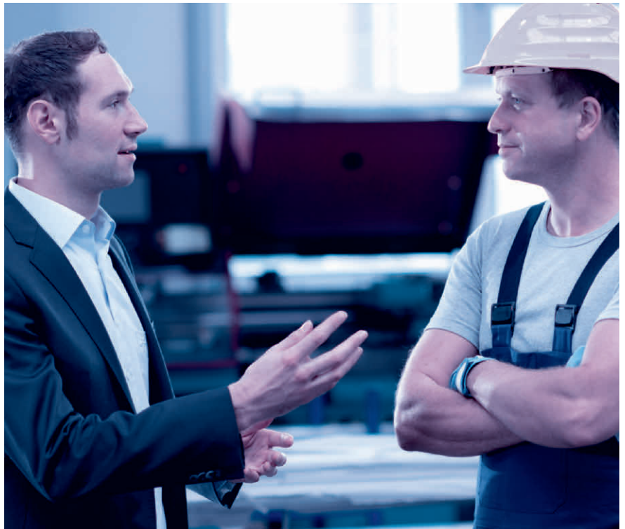
Das Mitarbeitergespräch ist keine Nebensache. Nehmen Sie sich Zeit und hören Sie zu.

Sinnvollerweise wird für das Mitarbeitergespräch zudem ein über die Jahre gleichbleibender Beurteilungsbogen mit einer Bewertungsskala (mit Smileys, Ampeln, Zahlen oder Buchstaben) verwendet.