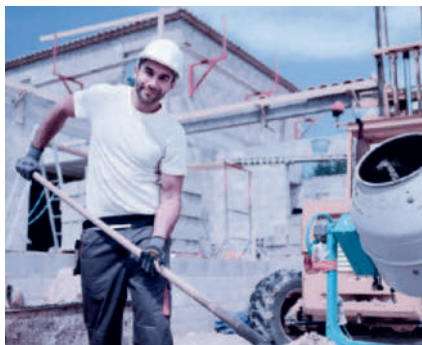
Zu den meldepflichtigen Berufsarten gehören neu alle Tätigkeiten für Hilfsarbeitskräfte, mit Ausnahme von Reinigungspersonal.

Liste der meldepflichtigen Berufsarten 2020: www.arbeit.swiss > Arbeitgeber > Stellenmeldepflicht